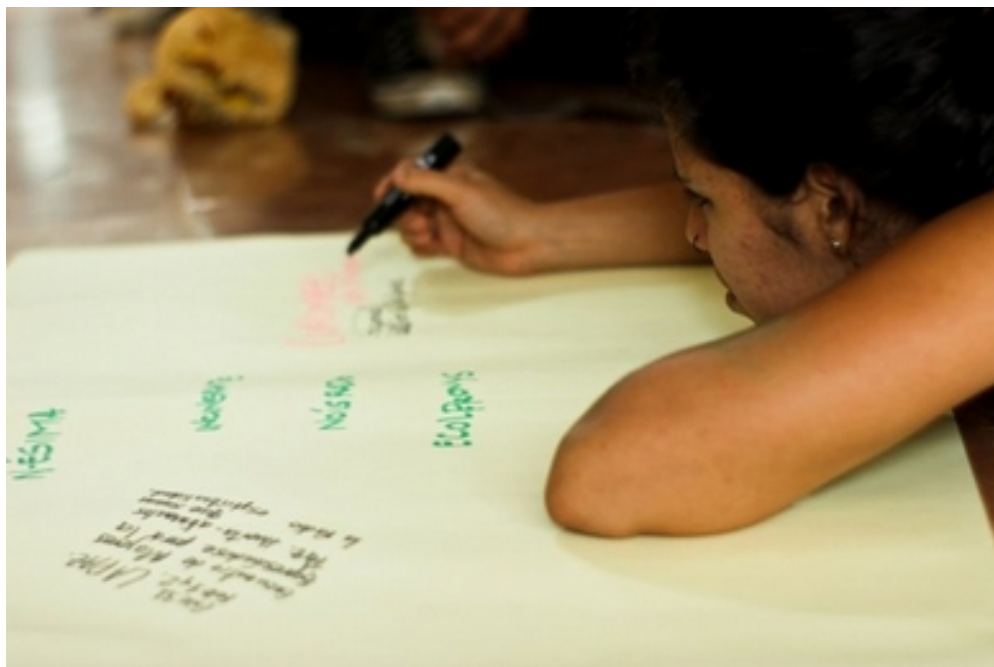
1er encuentro de soberanías: colectivxs que participaron del curcumazo y festival del trueke por el trabajo libre

Escuelita hacker: las mujeres de uno de los colectivos participantes en el