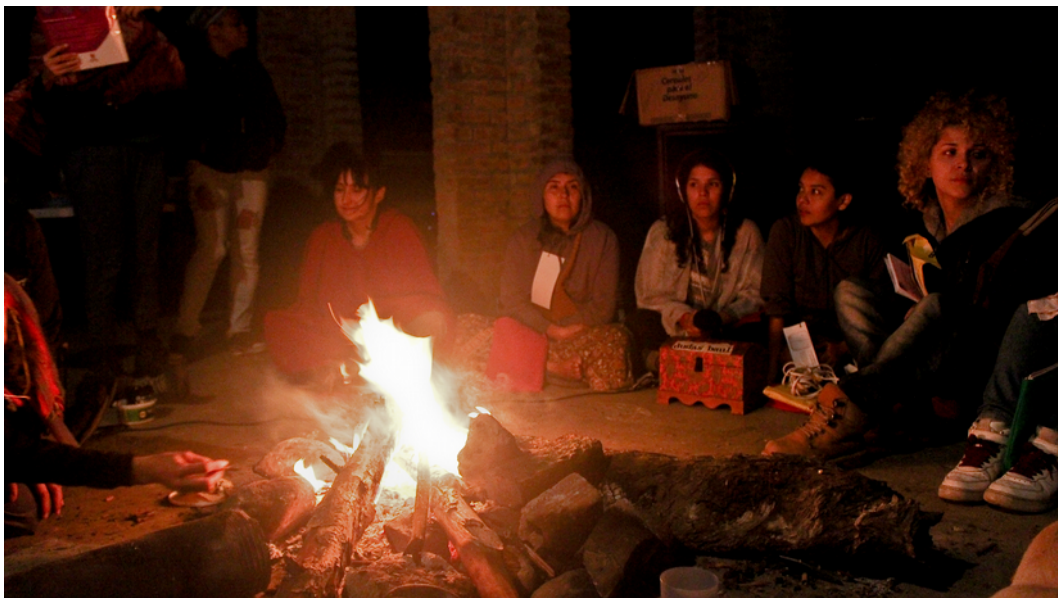
El ritual, considerado forma de convocar y armonizar, a partir de la espiritualidad feminista, también estuvo presente como metodología